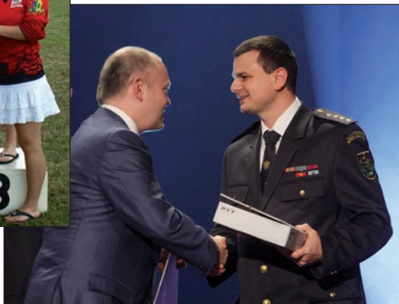
Slavnostní vyhlášení ankety Dobrovolní hasiči roku 2014