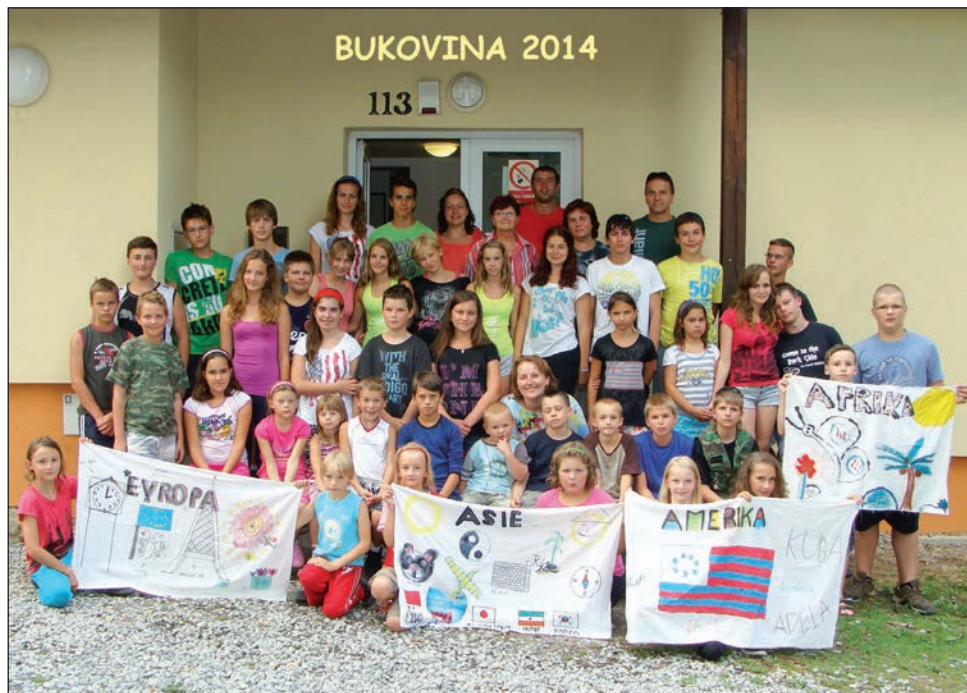
Olympiáda 2014 - orelský tábor