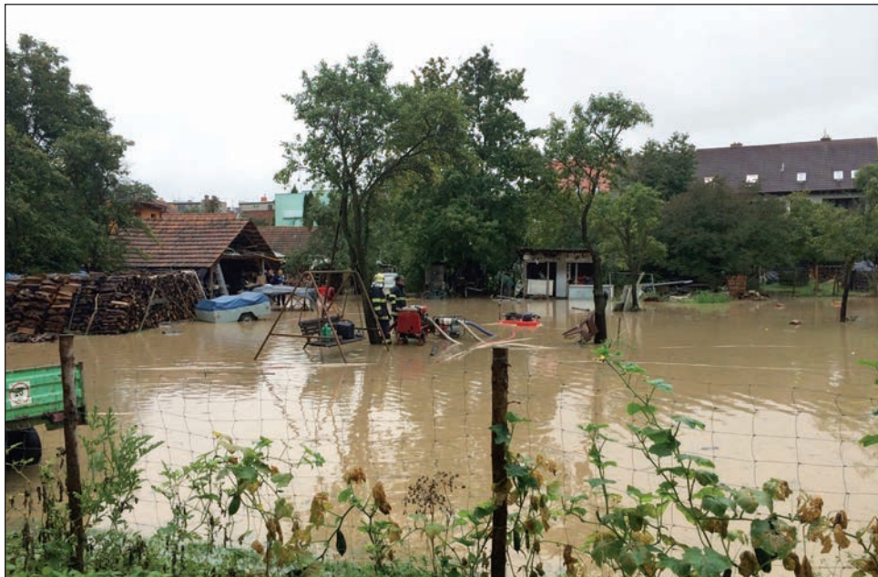
Přívalové deště v naší obci