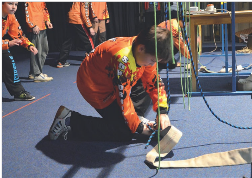
Soutěž mladých hasičů v uzlování