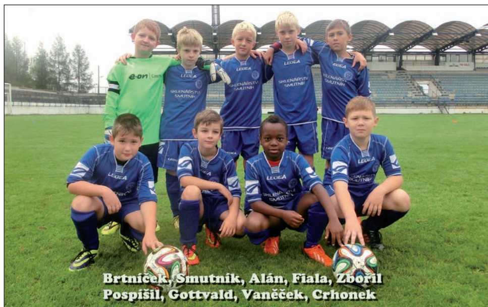
Starší přípravka B