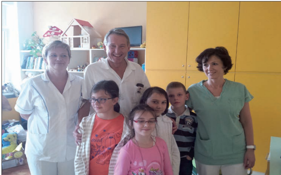
Děti pomáhají dětem