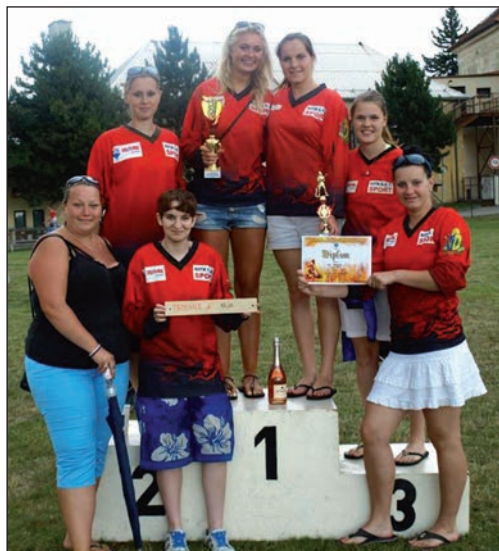
Družstvo žen na soutěži v Habrovanech