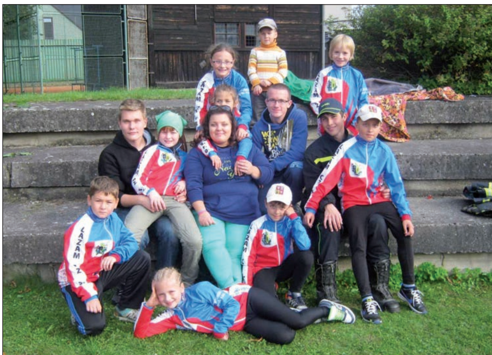
Naše výprava na Šumperského sptíka