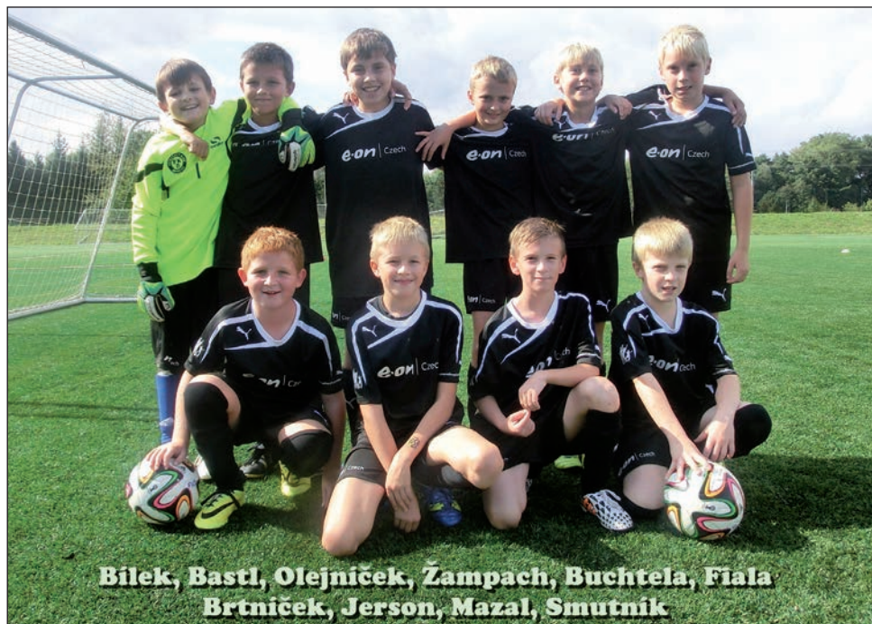
Starší přípravka A