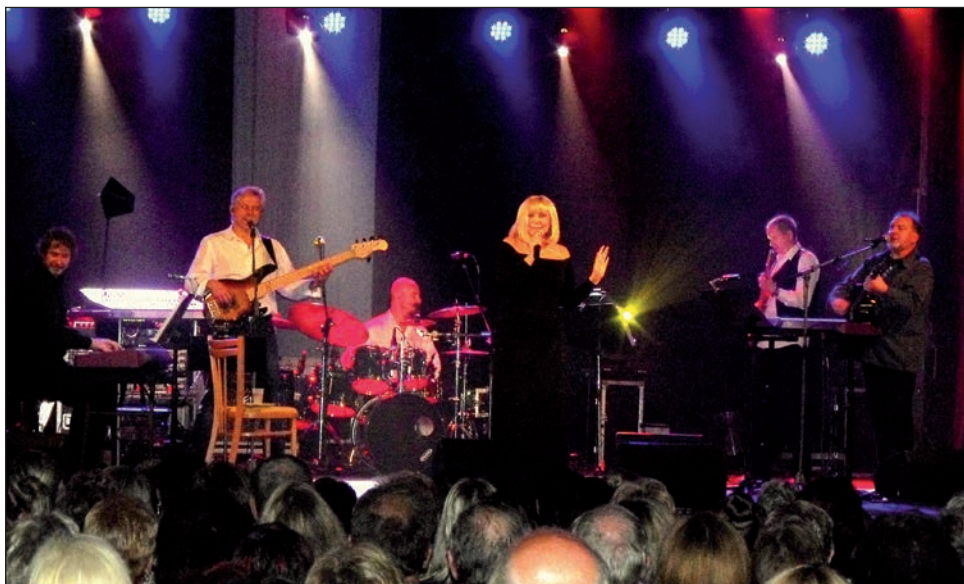
Koncert Hany Zagorové