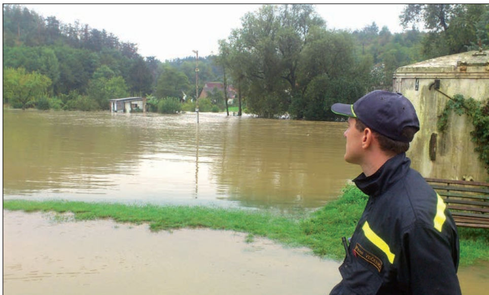
Povodňová situace na Znojemsku