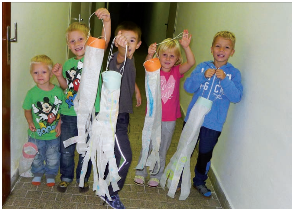
Dračí výtvarná dílna