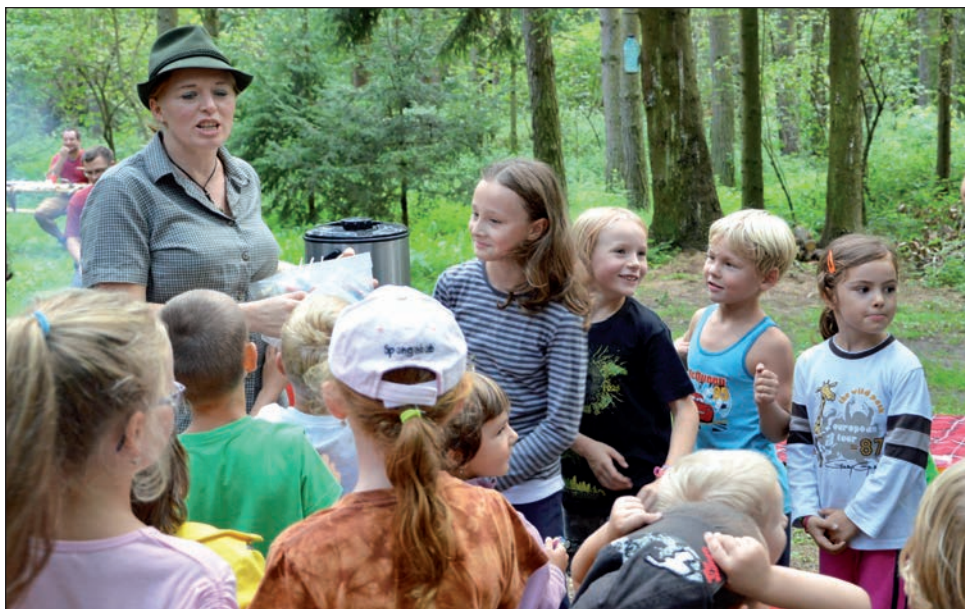
Rozloučení s prázdninami