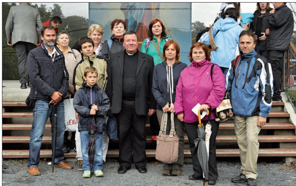
Celostátní pouť Orů na Sv. Hostýně