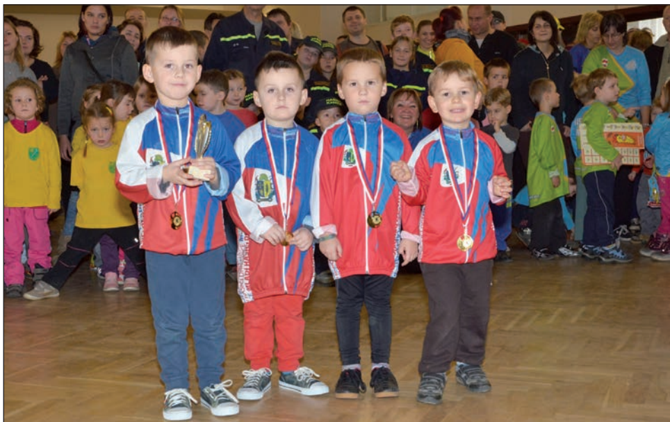
Zlatá přípravka na soutěži v uzlování